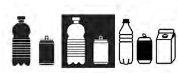
Dit zijn bijvoorbeeld de pictogrammen voor verpakkingsafval

In het kader van het volgende werkprogramma van het CDNI zijn er verschillende initiatieven voorzien om in de binnenvaartsector de aandacht te vestigen op deze richtsnoeren.